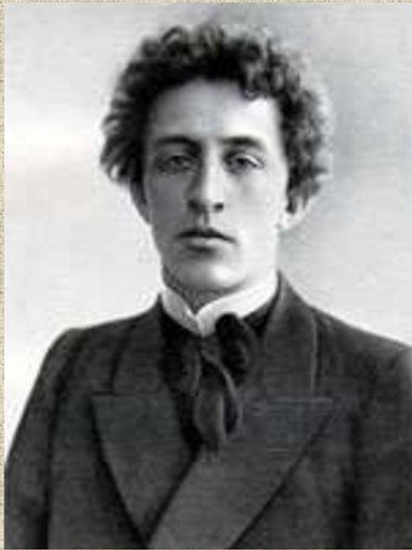
Александр Александрович Блок