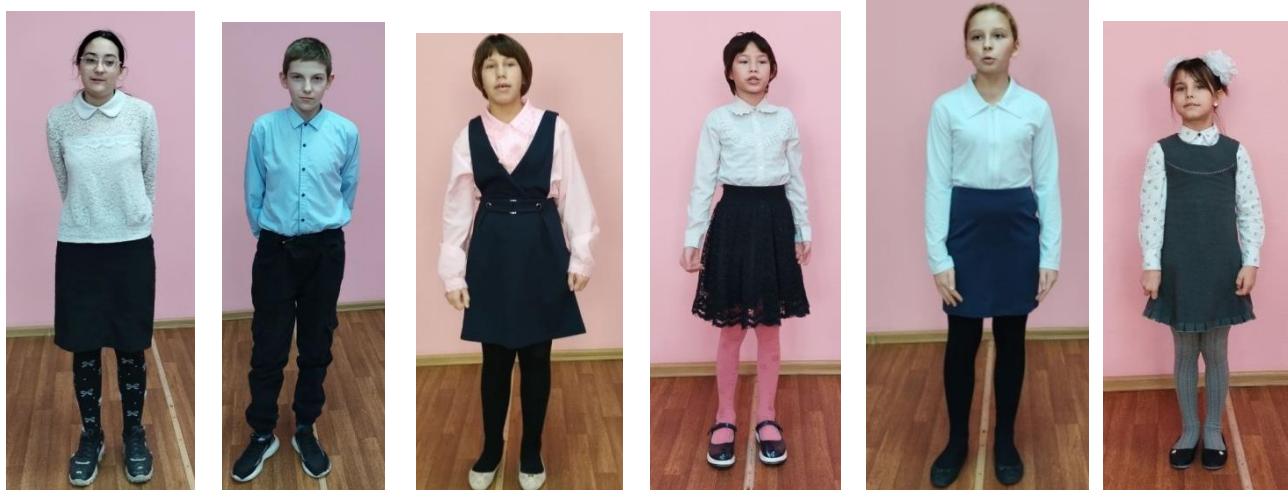
Ребята, занявшие 1 место.

В преддверии праздника "День матери" в школе-интернате прошёл конкурс юных чтецов. Доброжелательная обстановка, громкие аплодисменты зрителей воодушевляли юных чтецов. Каждый участник старался прочесть своё стихотворение лучше всех! В каждом ребёнке была видна особая индивидуальность. Конкурс дал возможность воспитанникам публично выступить, показать свой талант и продемонстрировать любовь к самому близкому и родному человеку - маме. Все участники конкурса были награждены грамотами!