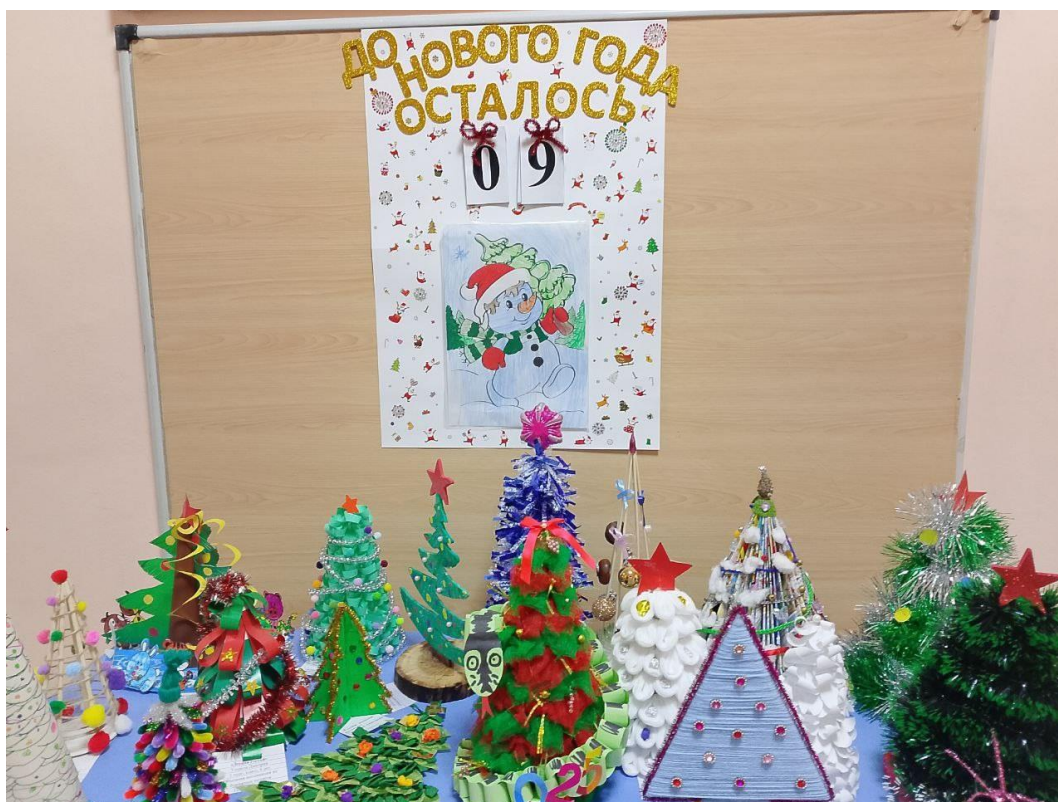
Новогоднее театрализованное представление «Скоро, скоро новый год»