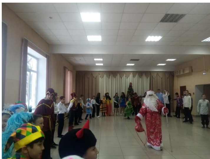
Наши ребята, посетили Обшаровский СДК №1 «Юбилейный» где состоялось